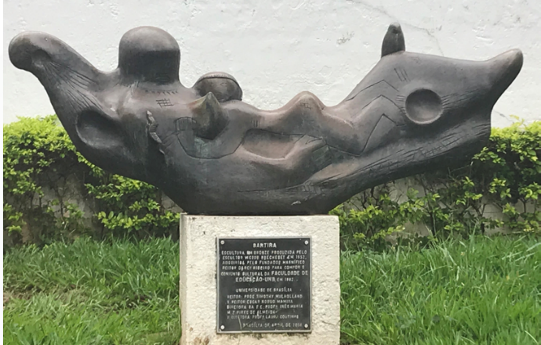
Índia Bartéria - Victor Brecheret